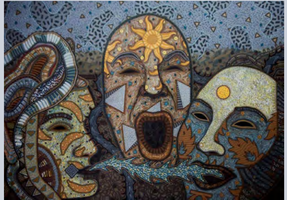
Canto final. 2011; acrílico sobre lienzo, 170 x 130 cm

Historiadora, ensayista y poeta. Yale University (EE.UU)