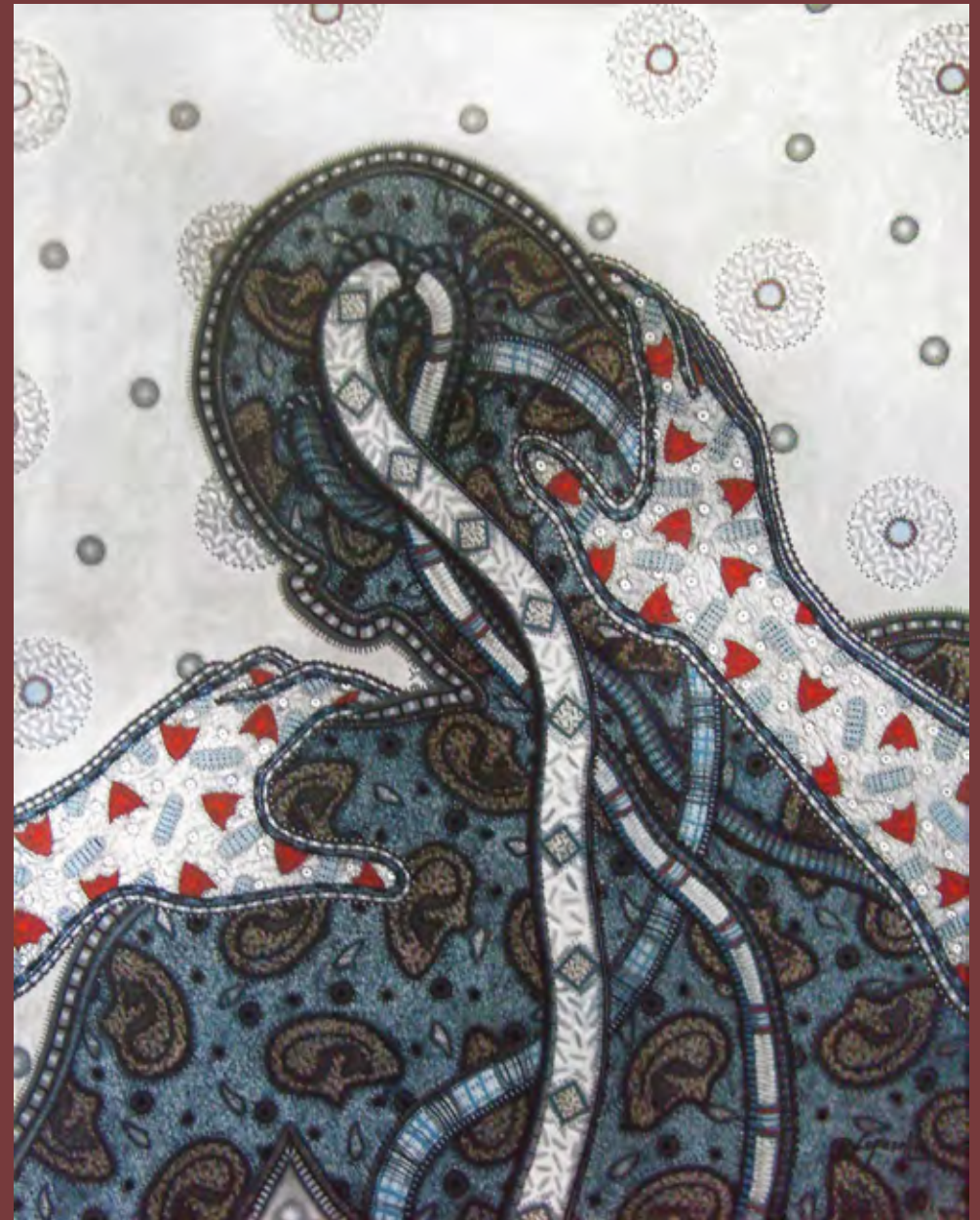
El ventrílocuo. 2010. acrílico/lienzo. 100 cms x 80 cms

Tomado de su texto en el plegable de la exposición de López Oliva titulada Sin catálogo , en Galería La Acacia, 1993.