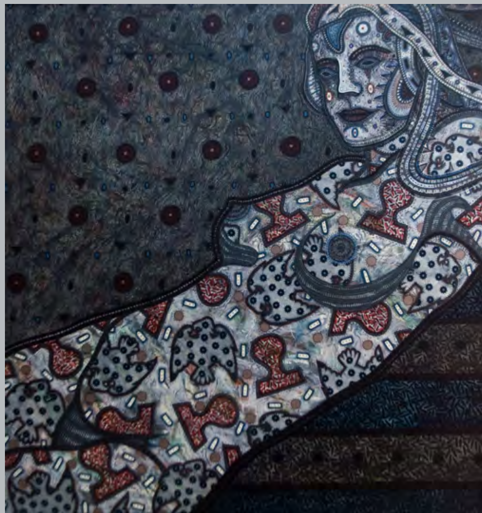
La seducción tiene máscara, 2009, acrílico sobre lienzo, 100 x 105 cm

La exposición constituye un tributo del Museo Nacional de Bellas Artes y del Consejo Nacional de Artes Plásticas a José Martí -que no implica un acto de ilustración o interpretación plástica sobre su retrato y su vida- sino el deber de revelar y exaltar la esencia martiana que pervive encarnada en estas obras exhibidas a partir de la víspera del aniversario del nacimiento del combatiente que trascendió su caída en Dos Ríos en la dimensión perenne del arte.