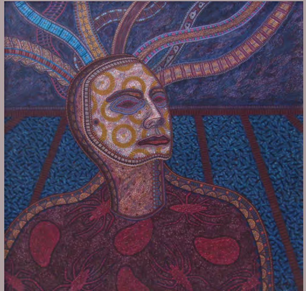
Brand. 1998. acrílico/lienzo. 100 cms x 100 cms

Tomado de “De catedrales y máscaras” /Opus Habana, Vol. III, No. 1, 1999, pp. 40-47.. jueves, 13 de julio de 2006.