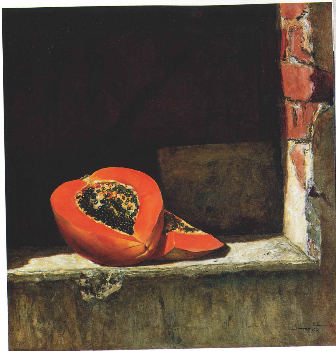
Delicias. Lienzografía facsimilar editada y firmada, 60 x 60 cm

s y privadas de na, Chile, Brasil, na, Panamá y